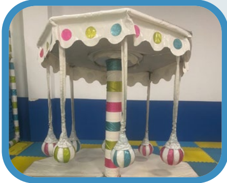
Atracción mecánica balones