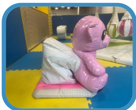
Juego oso mecánico