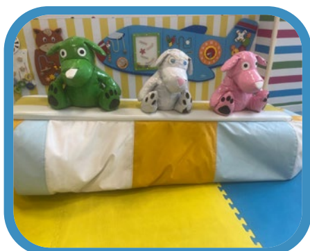
Sube y baja perros