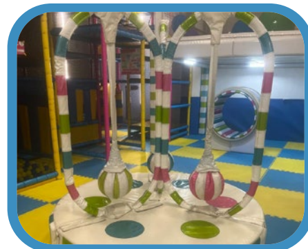
Atracción mecánica arcos