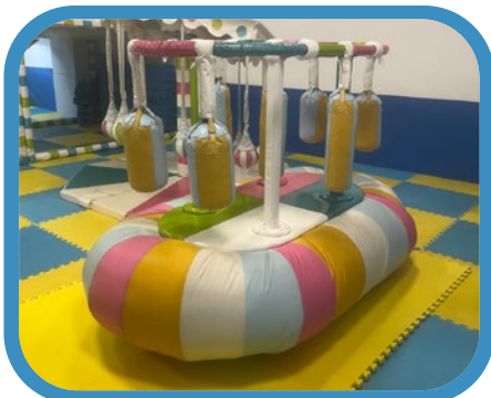
Atracción mecánica barco