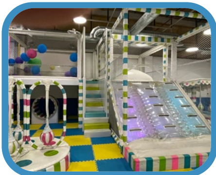
Combo globos y pompa