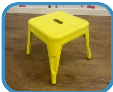
Taburete niño Sklum