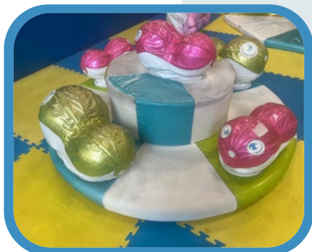
Atracción juegos a motor