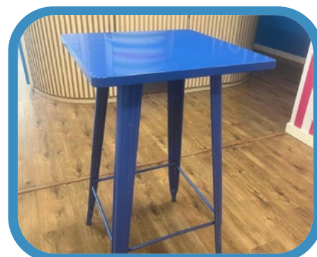
Mesa alta Sklum