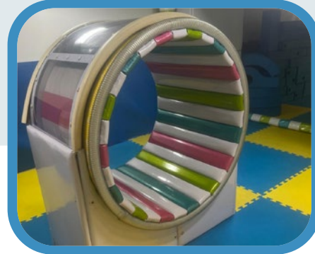
Atracción mecánica rueda de ratón