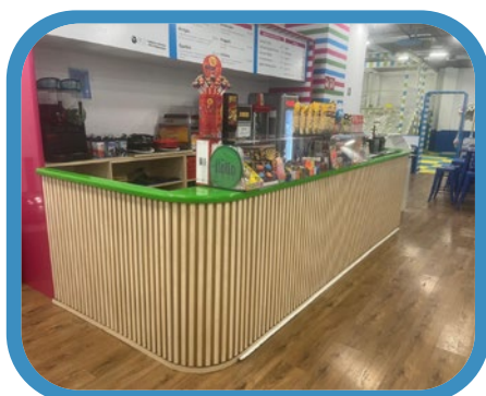
Barra de bar